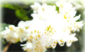
卯の花 (ウツギの花)