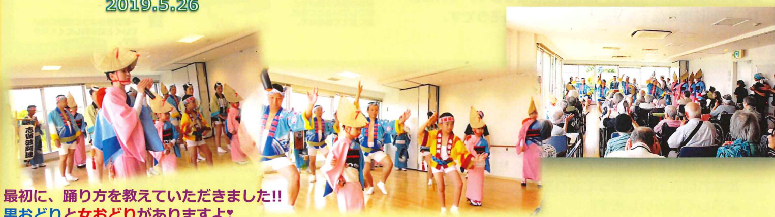
最初に、踊り方を教えていただきました!! 男おどりと女おどりがありますよ!