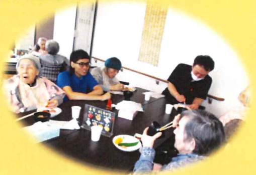
「やっぱり好きなものは 食べるのがはやいわね!」