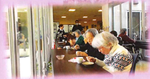
『甘いものが好きだから』