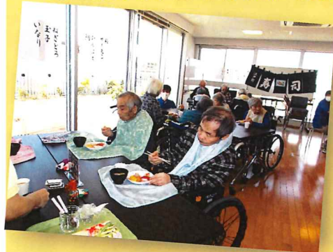
「これは何… ワサビですよ! これは いらなかな」

3階機能訓練室に、勢揃いしおいしいお寿司に皆さん箸が進んでいました。間違えてわさびの固まりを、食べて涙している方も…。ちなみに、好評だったネタは、1位はマグロ、2位はサーモン。いくつもおかわりされた方もおいででした。やっぱり皆さん お寿司は大好きですね!! お酢の御飯の匂いにあふれ楽しくおいしい時間でした!!