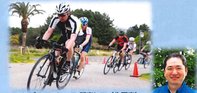
インデューロレース 関東にて (先頭車)