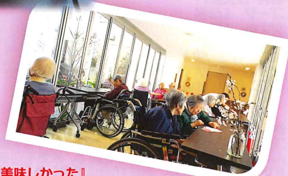
『ようかん美味しかった』